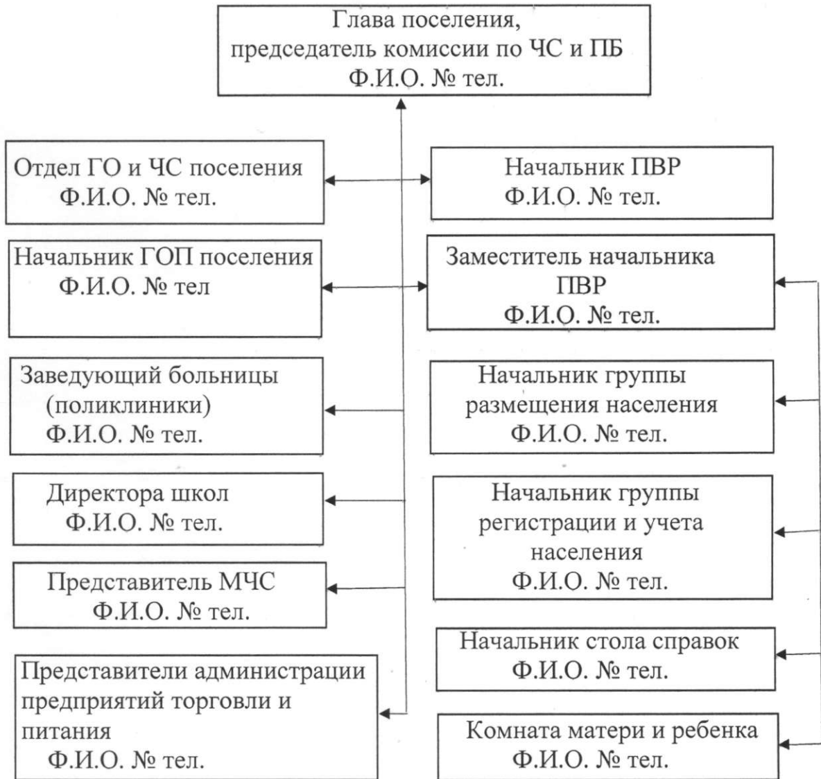
Схема связи и управления пункта временного размещения