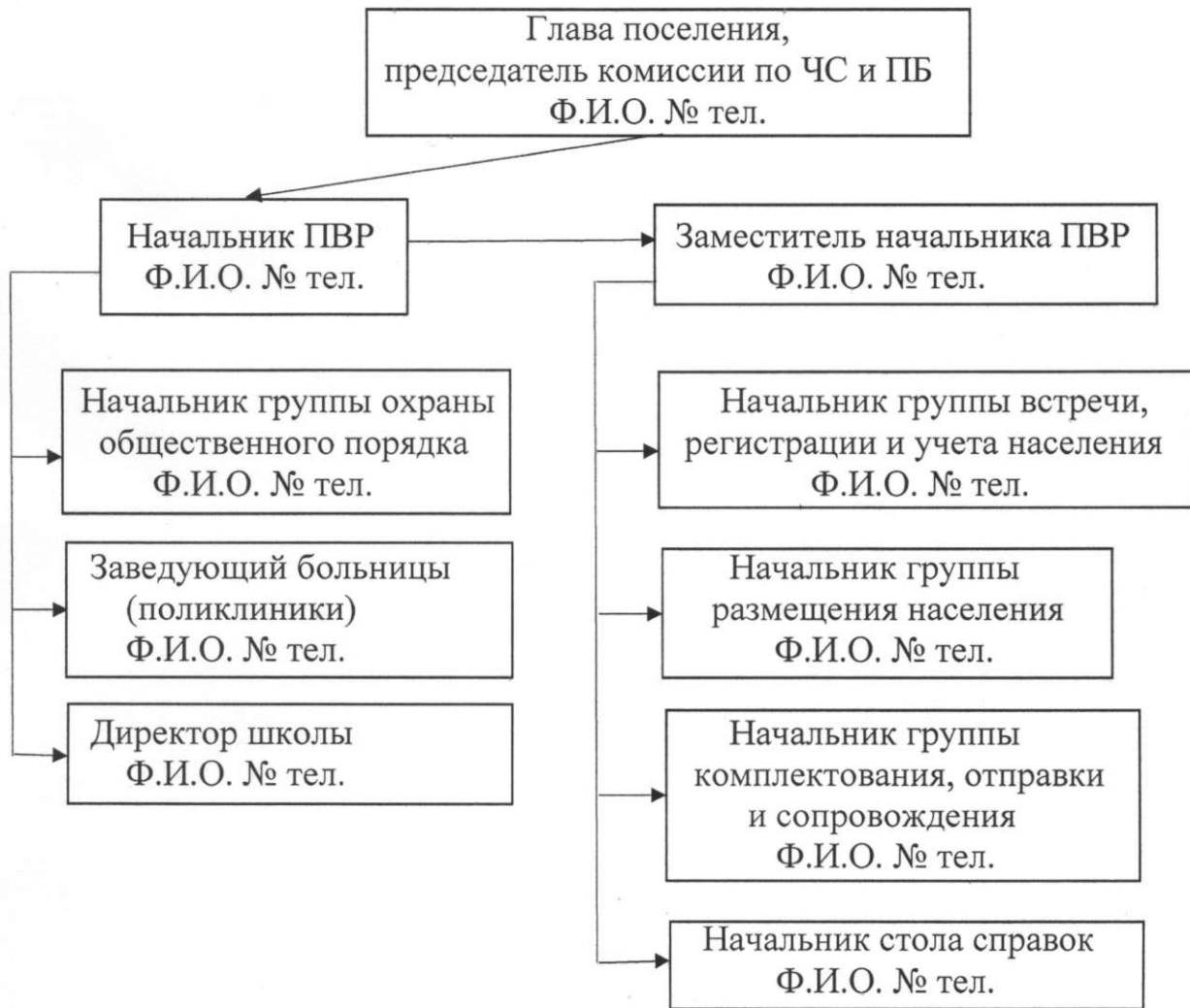
Схема оповещения и сбора администрации пункта временного размещения